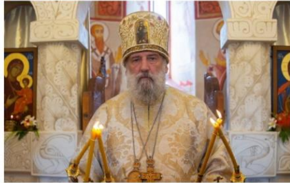
„იხარებოდა პურკლედან, ვრცე აოქმბე მამაშობაჩარა დეზოტრადის, ყოველივინ სხვისიდა სხვით ოამაში“. – გამაქმედა ქოთილ-ვაქნალოვს მატრონილდის ოამებ 2020 წლის პარლამენტის არჩევნებთან დაკავშირებით. დარწლიდის კოიჩეაზე, მილოცა თუ არა მამ გამარჯვება მმაროდელ ვენის, ეპსკოპოსმა თუჯა, რომ გამარჯვება ყველამ უნდა მივლოცოთ. – გამარჯვება ყველამ უნდა მივლოცოთ, რათა ქვეყანა იყოს მშვიდობა ვაისარჯა? ხელის ხმა არის? – მივლოცოთ არა მარტო ჩვენთან, ამერკაშელ ასეა, გამარჯვება სრულხეცტა? – ევლოცავო მაროალი, ტრამა არ ვომბებთ, მარამ დაამტკუნო, რომ ვაქალხებს სქონია ავილო? – აქმინა პიტრონილდებ.