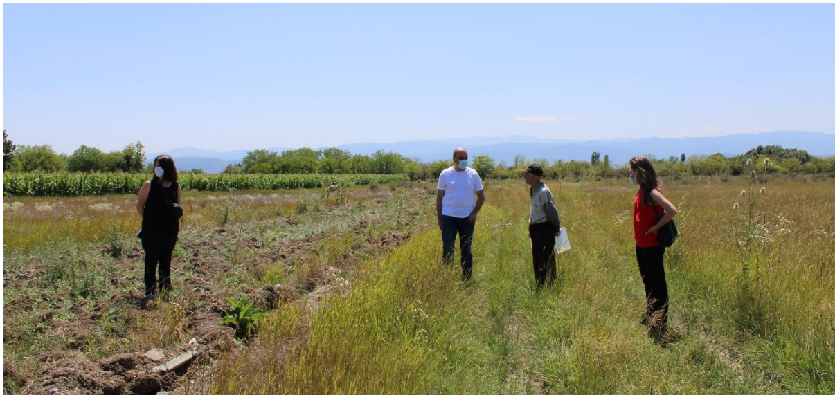
ხნული - საოკუპაციო საზღვარი