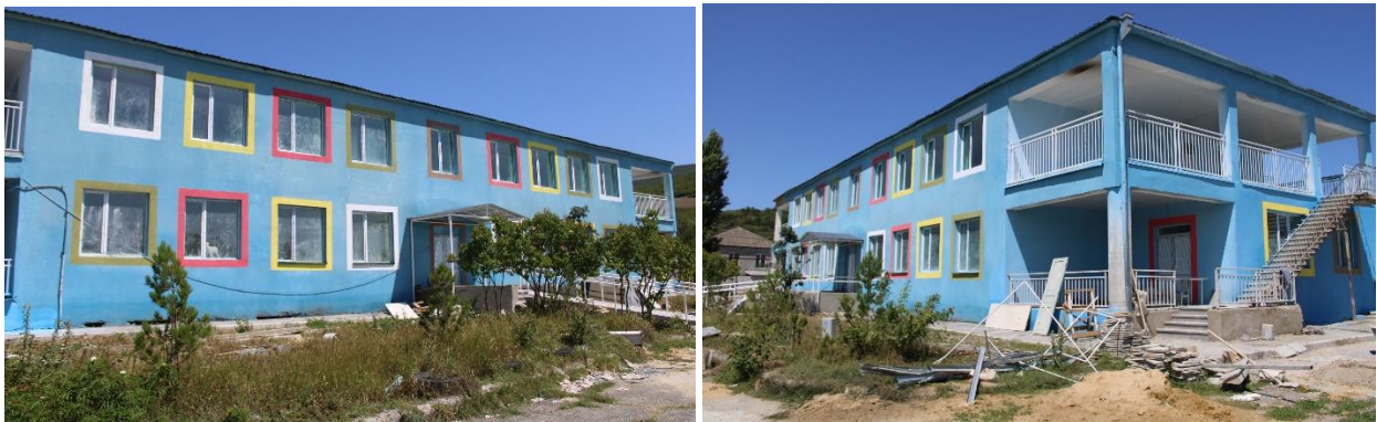
სოფელი ქვემო ჭალის ბაღის რეაბილიტაცია

სოფელ ქვემო ჭალაში 1,075 მაცხოვრებელია, 536 კაცი და 539 ქალი. ადგილობრივებისთვის მთავარი პრობლემა სარწყავი სისტემის არარსებობაა. ქვემო ჭალას მაცხოვრებლებს პრობლემები საკორინთლოს პრობლემებისგან მხოლოდ იმით განსხვავდება, რომ ქვემო ჭალა თემის ცენტრია და საჯარო სკოლა ფუნქციონირებს. დემოკრატიის კვლევის ინსტიტუტის წარმომადგენლების ვიზიტის დროს, სოფელში მდებარე საბავშვო ბაღის კაპიტალური რემონტი მიმდინარეობდა, რომელიც, სავარაუდოდ, სექტემბერში დასრულდება.