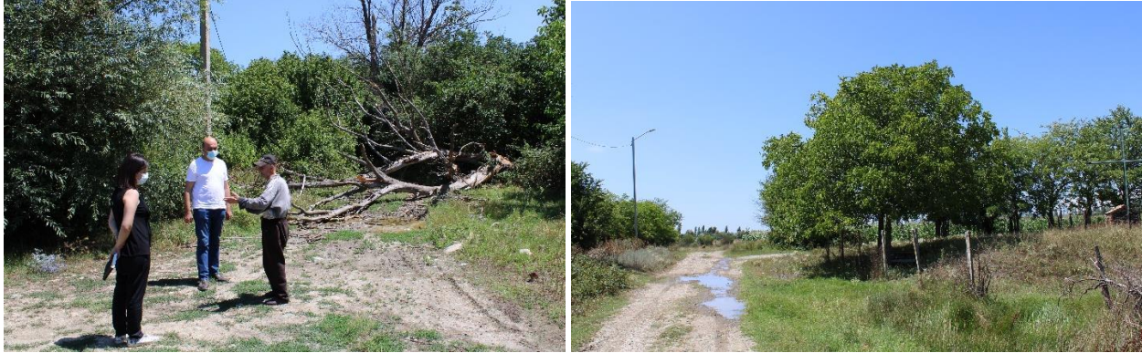
სოფელიჯარიაშენი, შეხვედრა ელიზბარ მესტუმრიშვილთან

გავლებული ხნული, რომლის იქითაც ოკუპირებული ტერიტორია იწყება. ადგილობრივების მიწის ნაკვეთები ოკუპირებულ ტერიტორიაზეა მოქცეული. 1