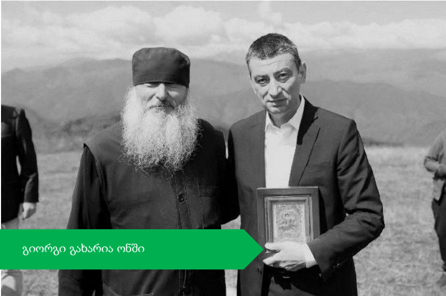
გიორგი გახარია ონში