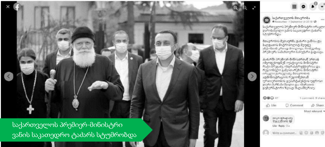
საქართველოს პრემიერ-მინისტრი ვანის საკათედრო ტაძარს სტუმრობდა