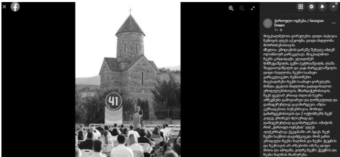
„ქართული ოცნების“ კანდიდატების წარდგენა შიდა ქართლში