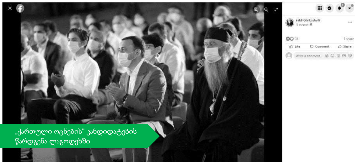
„ქართული ოცნების“ კანდიდატების წარდგენა ლაგოდეხში