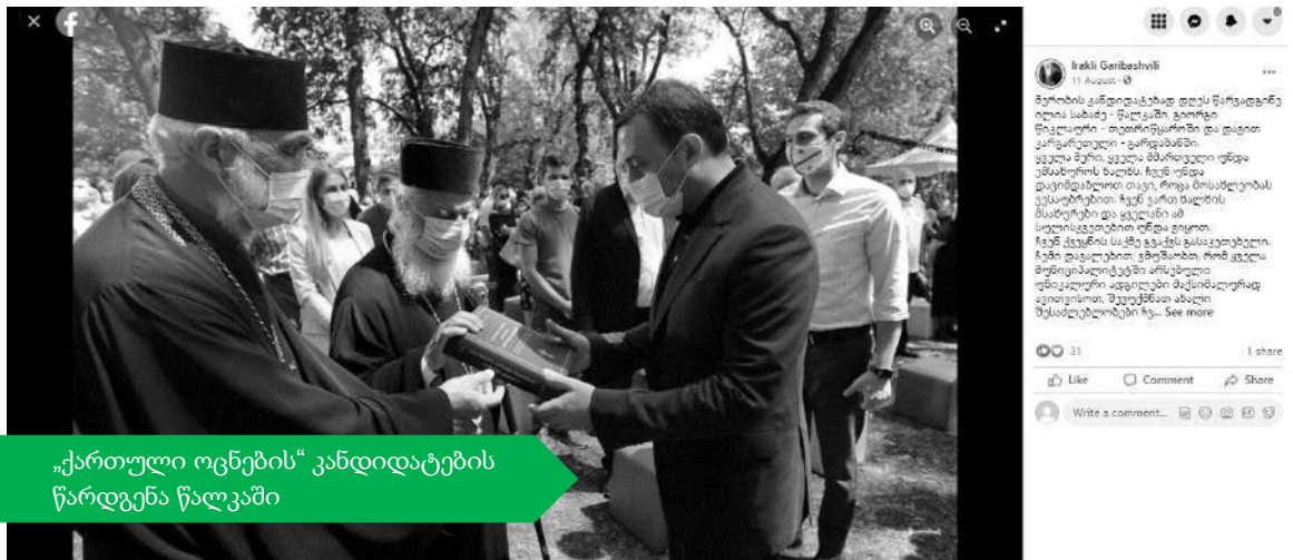
„ქართული ოცნების“ კანდიდატების წარდგენა წალკაში