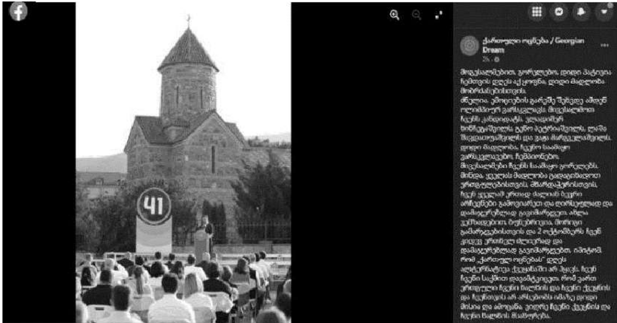
„ქართული ოცნების“ კანდიდატების წარდგენა შიდა ქართლში

ყოფით მოიპოვოს რელიგიური ორგანიზაციის წარმომადგენელთა მხარდაჭერა. ორმხრივად ხელსაყრელი პრაგმატული ურთიერთდამოკიდებულება კი ეკლესიისა და ხელისუფლების ურთიერთშეზღუდვის მანკიერ პრაქტიკას ასაზრდოებს.